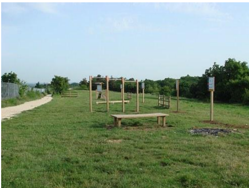
Figura 5: esempio di area attrezzata

Vantaggi: implementare la possibilità di fare sport all'aria aperta a Pavona.