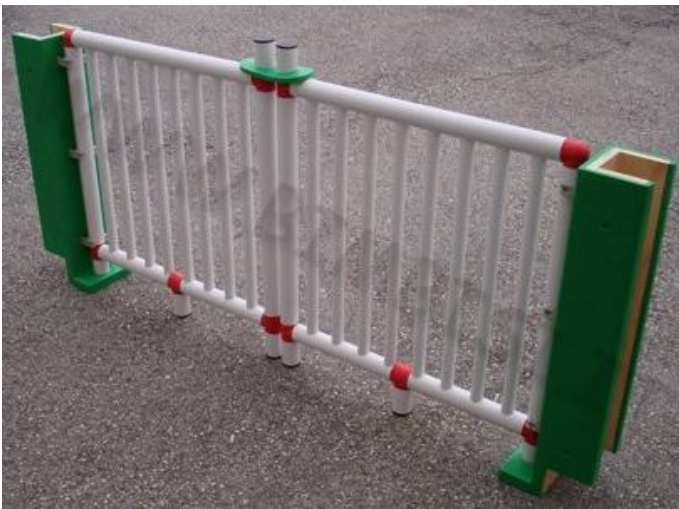
Figura 1: cancelletto di sicurezza

Gli stipiti possono essere ancorati alle ante aperte del cancello attuale.