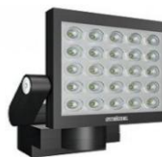
Figura n. 2: esempio di faretto a led da esterno

Vantaggi: migliora la visibilità e la sicurezza dei frequentatori di Villa Contarini anche nei pomeriggi invernali, con consumi e costi ridotti.