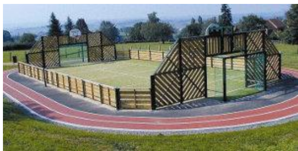
Figura 6: esempi di campo polivalente.

Vantaggi: offrire uno spazio sicuro anche ai ragazzi più grandi di Pavona.