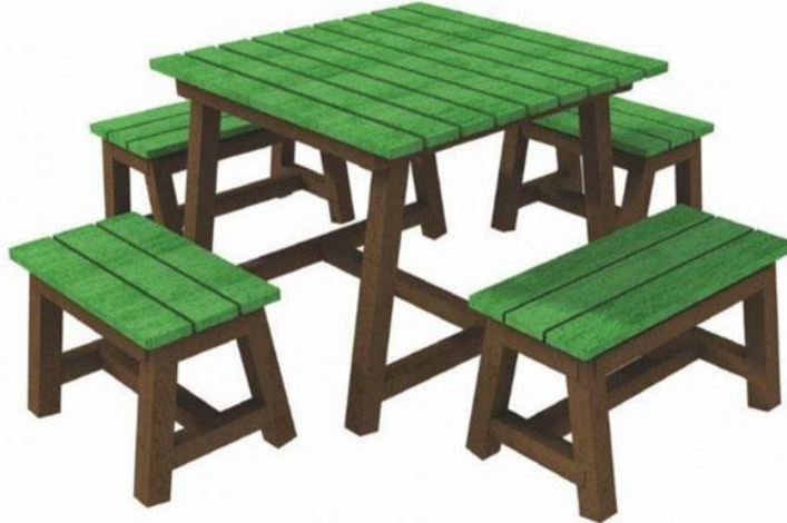
Figura 4: esempio di arredo in plastica riciclata (ancorato a terra).

http://www.piemme-italia.com/arredi_urbani_pachi_gioco_plastica_riciclata.html